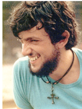
"Martire della carità", Lele ha pagato col sangue la scelta di essere mite fino alla fine.

Padre Lele ci arriva, all'età di 31 anni, nell'estate del 1984. Viene da un periodo di formazione in Italia e