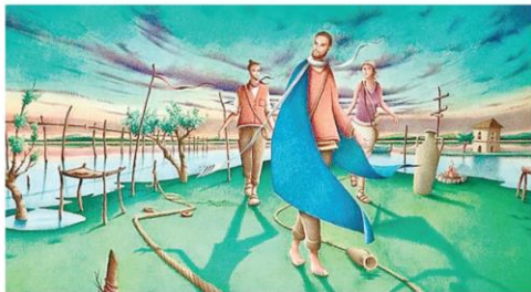
Particolare del poster preparato per la "giornata" dall'Ufficio Nazionale della CEI per la pastorale delle vocazioni.

Signore Gesù, seguire te è far sbocciare sogni e prendere decisioni: è darsi al meglio della vita. Attratti all'incontro con te e chiamaci a seguirti per ricevere da te il regalo della vocazione: crescere, maturare e divenire dono per gli altri. Amen.